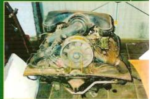
Deze 2-liter motor is nog origineel. Het ding levert 110 pk en zal na een grondige revisie weer lopen als hij dat eens heeft gedaan.